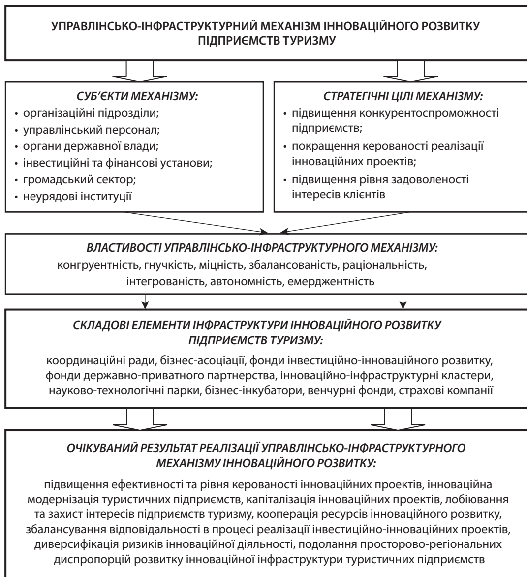
Рис. 3. Структура управлінсько-інфраструктурного механізму інноваційного розвитку туристичних підприємств

Maslak, O. I., Bezruchko, O. O., and Maslak, M. V. "Upravlinnia innovatsiinym potentsialom pidpriemstva v umovakh tsyklichnosti" [Managing the innovation potential of the enterprise in terms of cyclicity]. Ekonomika i orhanizatsiia upravlinnia , no. 1-2 (2014): 166-173.