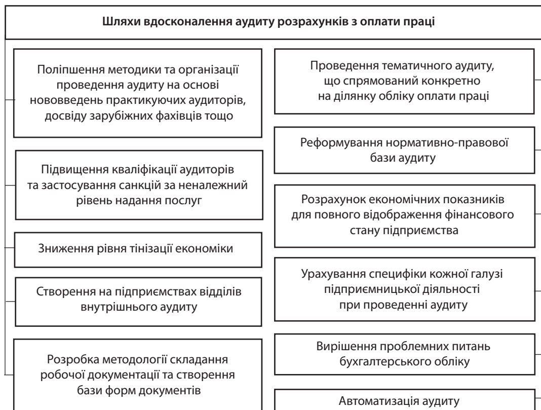
Рис. 2. Шляхи вдосконалення аудиту розрахунків з оплати праці

6. Новік К. П. Проблеми підвищення якості аудиторської діяльності // Збірник матеріалів III Всеукраїнської науково-практичної конференції «Сучасні проблеми обліку, аналізу, аудиту й оподаткування суб'єктів господарської