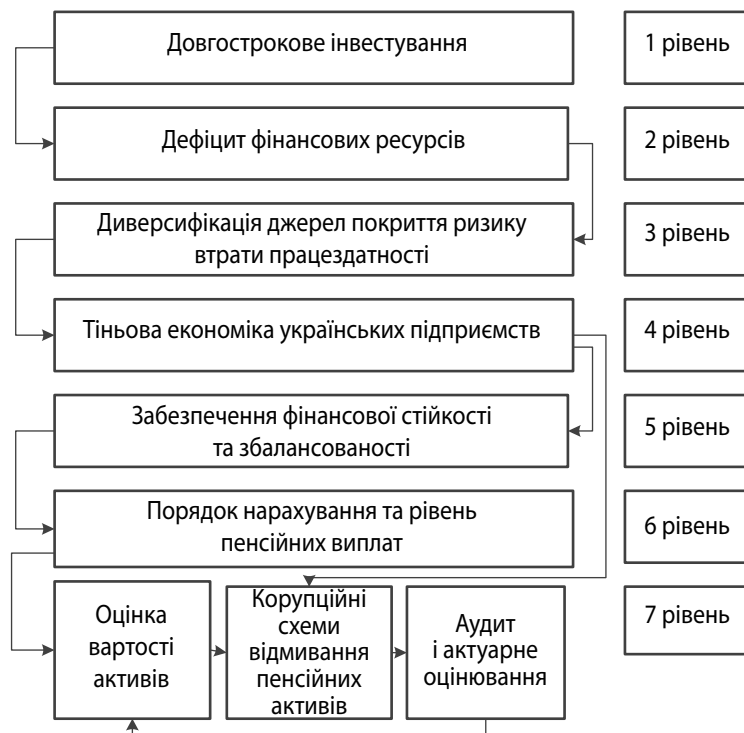
Рис. 3. Ієрархія впливу ризиків щодо шляхів удосконалення механізму державного регулювання загальнообов'язкового накопичувального пенсійного забезпечення

З апропоновано шляхи вдосконалення механізму державного регулювання загальнообов'язкового накопичувального пенсійного забезпечення, що сприятиме комплексній побудові ризик-орієнтованого підходу та забезпечить стабільність всієї пенсійної системи: