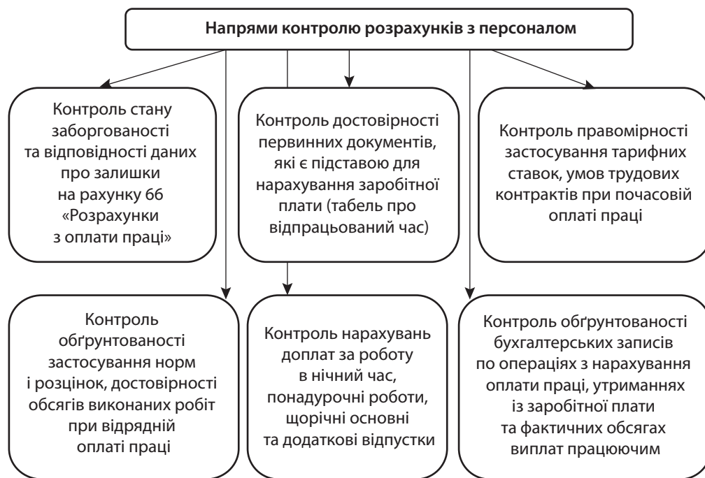
Рис. 3. Напрями контролю розрахунків з персоналом вітчизняних підприємств

П ід час контролю особливу увагу необхідно приділяти первинним документам, що регламентують відносини з працівниками, а також нарахування та виплату заробітної плати. У процесі контролю потрібно здійснювати систематичний контроль за використанням фонду заробітної плати, виявляти можливість економії коштів за рахунок зростання продуктивності праці та зниження трудомісткості продукції. Тому контроль за оплатою праці