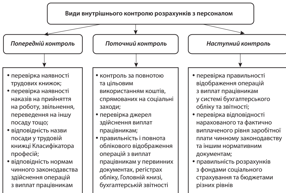
Рис. 2. Завдання контролю розрахунків з персоналом підприємства

Висновки за результатами контролю сприятимуть раціоналізації та цілеспрямованості використання коштів на оплату праці, що, своєю чергою, дозволить упередити та мінімізувати ризики плинності кадрів, професійного розвитку працівників та застосування мотиваційного механізму в кожному конкретному випадку, зважаючи на специфіку та потреби суб'єкта господарювання.