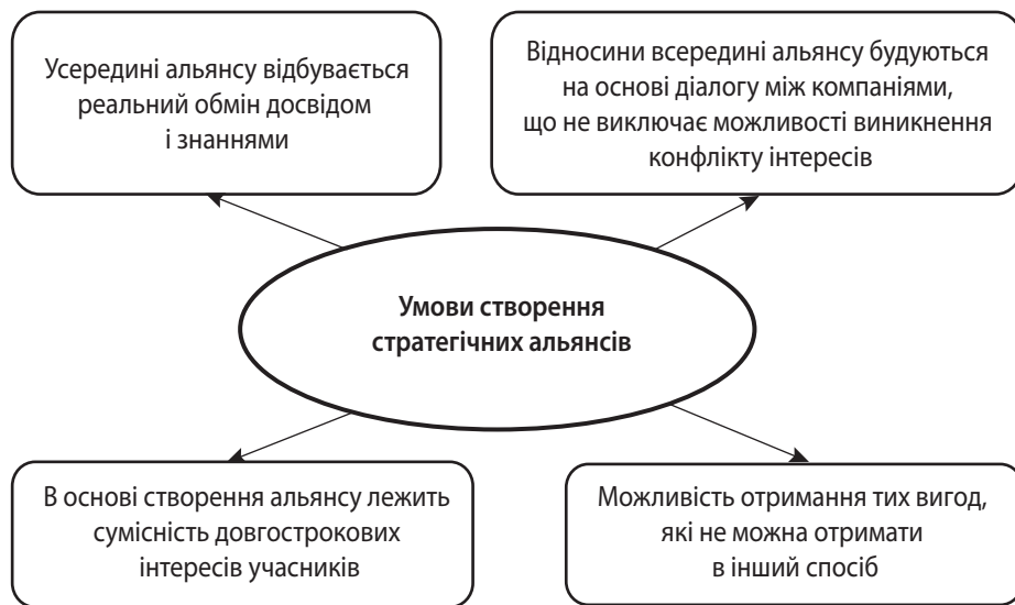
Рис. 3. Умови створення стратегічних альянсів