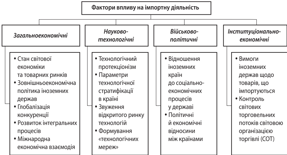
Рис. 2. Фактори впливу на імпорتنу діяльність