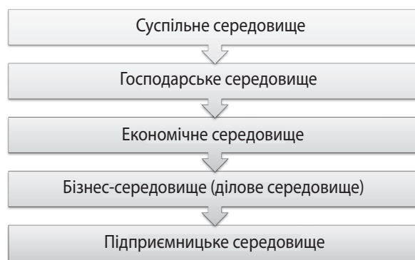
Рис. 1. Структурна ієрархія поняття «середовище» за принципом зростання ступеня охоплення економічних відносин

У науковій літературі поняття «бізнес-середовище» часто підмінюють спорідненими категоріями, які вживають як синоніми. Визначення рівня «бізнес-середовище» в структурній ієрархії поняття «середовище» за принципом зростання ступеня охоплення економічних відносин наведено на рис. 1 .