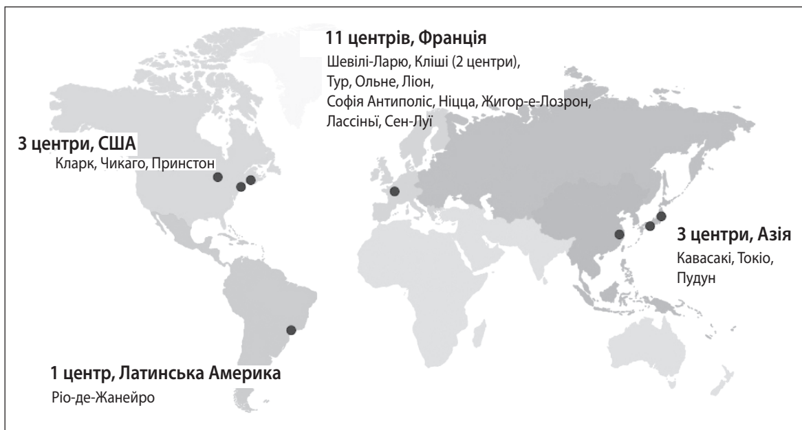
Рис. 1. Найбільші науково-дослідницькі центри компанії L'Oréal Group [12]

інноваційні дослідження (тканинної інженерії, декодування геному людини тощо). Спираючись на розмаїтість команд L'Oréal Group, багатство та взаємодоповнюваність портфеля брендів, компанія зробила універсалізацію краси свого проекту на роки вперед, пропонуючи красу для всіх. Компанія завжди робила великі інвестиції в дослідження та ставить косметичні інновації в самому центрі своєї моделі зростання. Звернення до тестування нового покоління дозволяє оцінити безпеку інгредієнтів без тестування на тваринах (компанія L'Oréal зупинила тестування готової продукції на тваринах у 1989 р.), і найближчим часом, зможуть оцінити клінічну ефективність, не вдаючись до біопсії (відбір проб тканини людини). За останні 50 років компанія L'Oréal успішно запатентувала основні активні інгредієнти своїх молекулярних формул, демонструючи їх безпеку й ефективність та значно випереджаючи конкурентів.