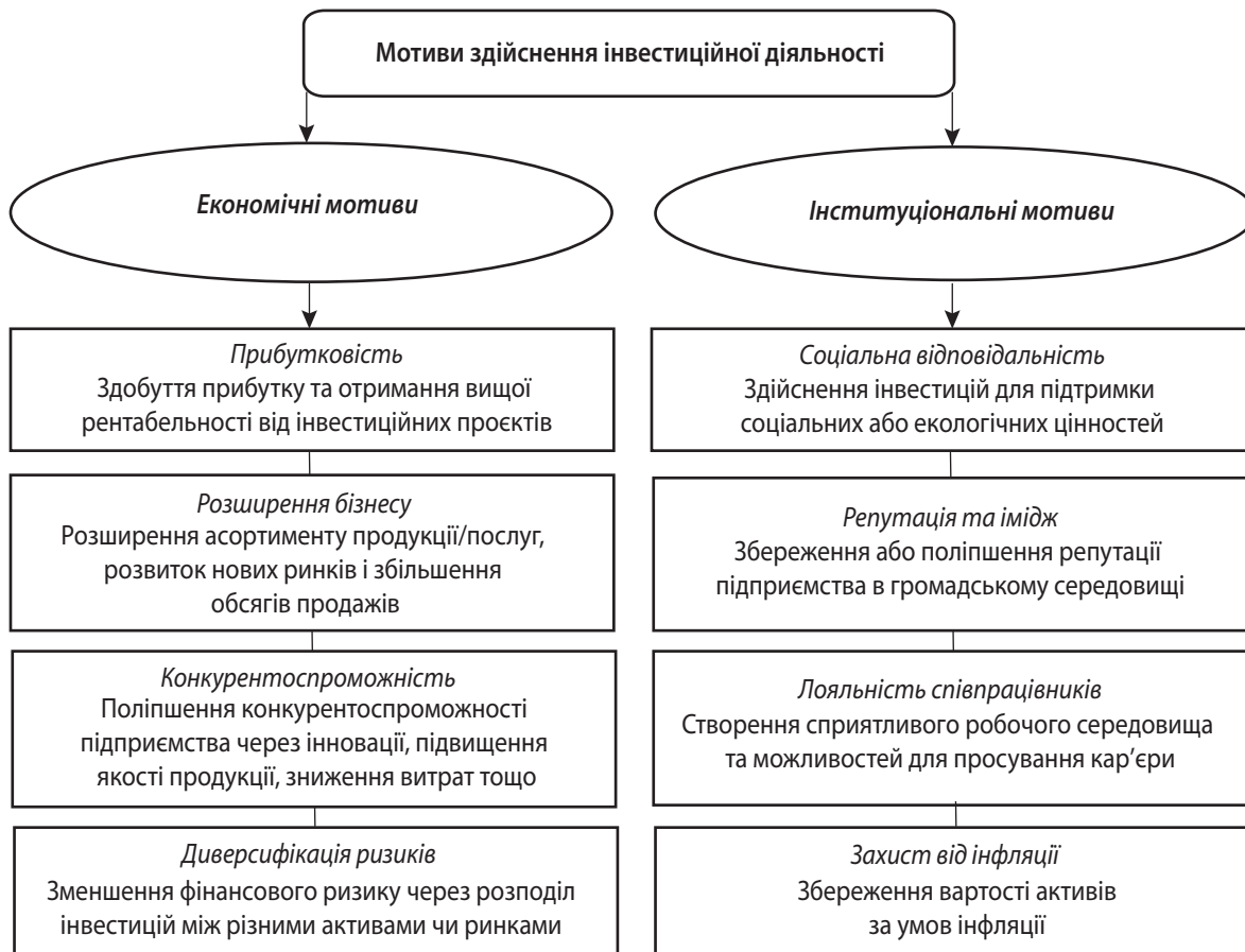
Рис. 2. Мотиви здійснення інвестиційної діяльності