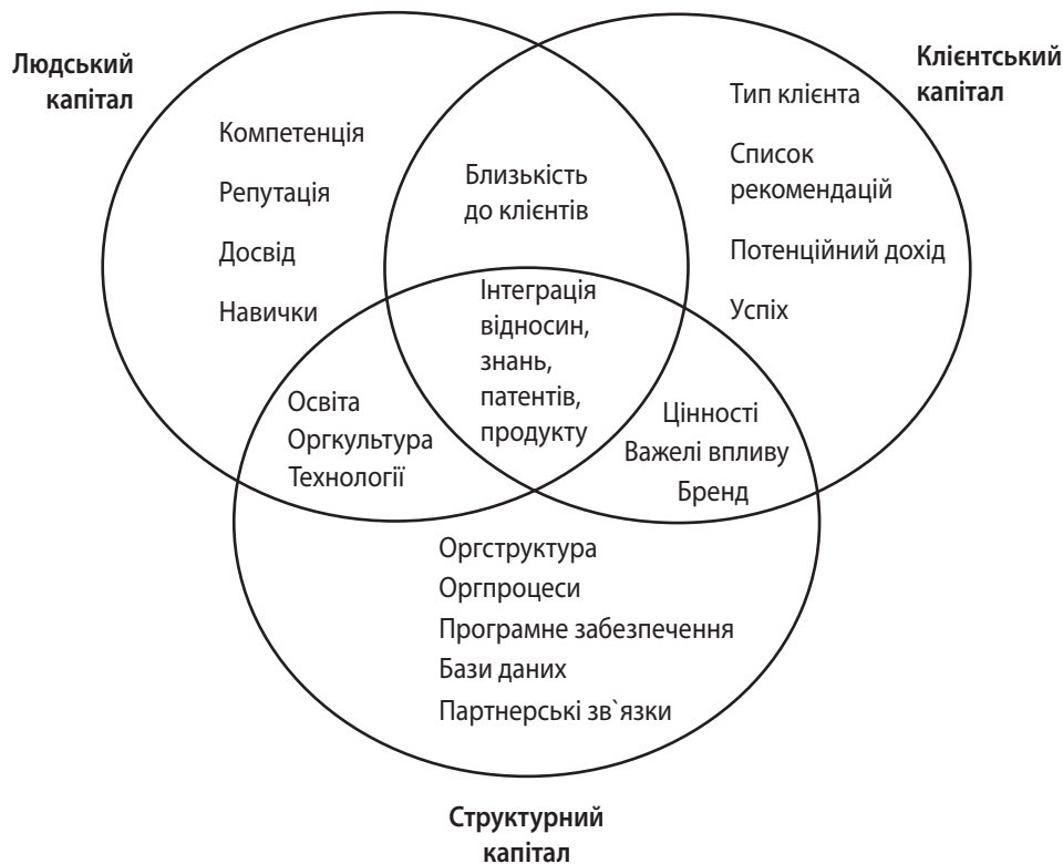
Рис. 2. Модель FiMIAM