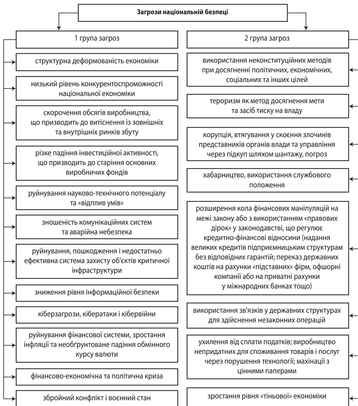
Рис. 2. Класифікація загроз національній безпеці України