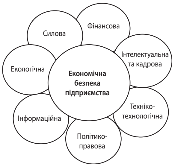
Рис. 2. Складові економічної безпеки підприємства

мічної безпеки підприємства полягає в забезпеченні його стабільного функціонування та розвитку за сучасних умов, створенні передумов для подальшого розвитку.