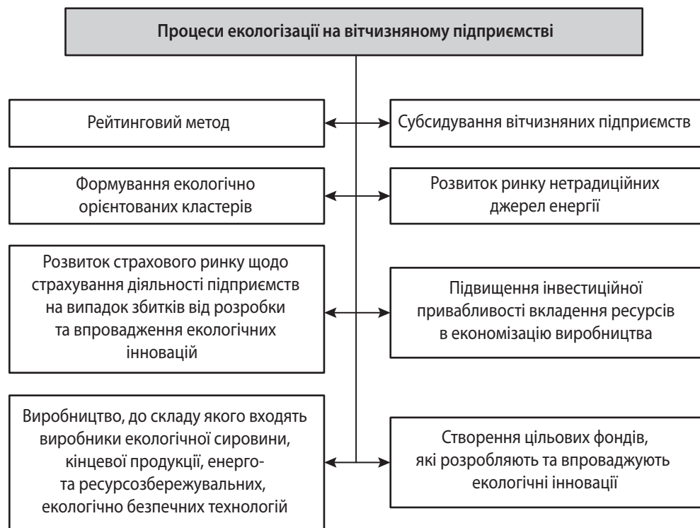
Рис. 3. Комплексний підхід до екологізації на вітчизняних підприємствах