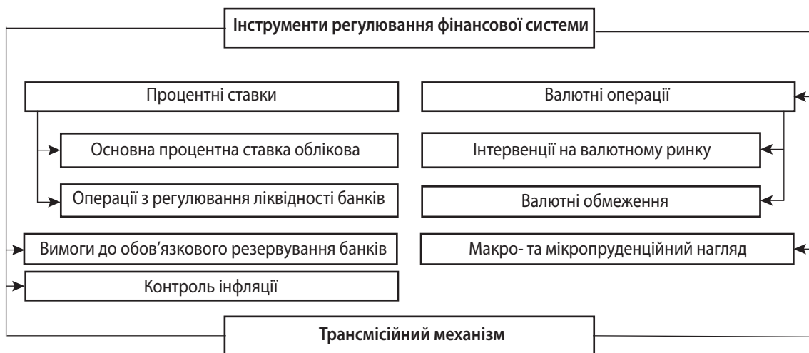
Рис. 3. Інструменти регулювання фінансової система та макроекономіки

В основу макропруденційної політики покладено постійний моніторинг і контроль за ризиками на фінансових ринках, розвиток законодавства та впровадження сучасних стандартів щодо регулювання діяльності фінансових установ, а також забезпечення координації між різними суб'єктами фінансової системи, що забезпечує підтримання фінансової стійкості та стабільності.