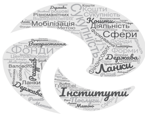
Рис. 1. Карта ключових слів, що характеризують поняття «Фінансова система»