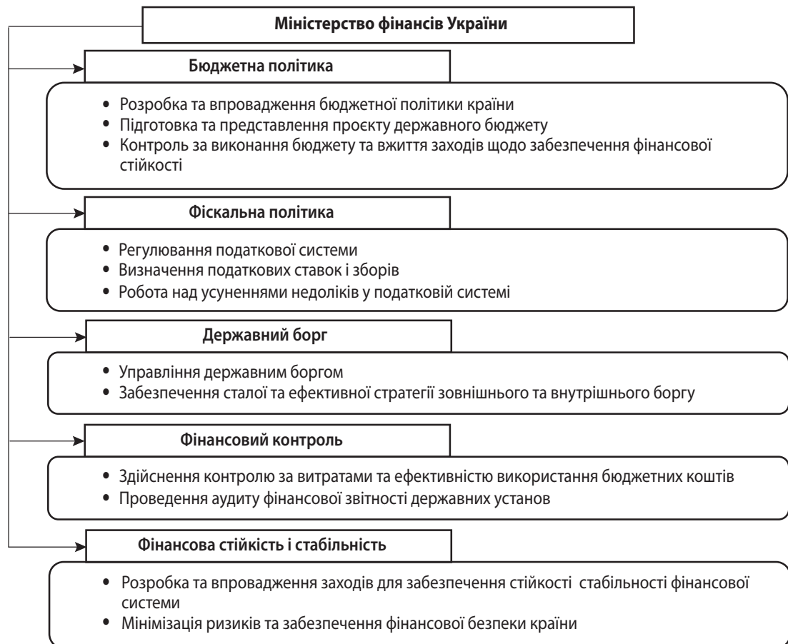
Рис. 4. Основні завдання Міністерства фінансів України