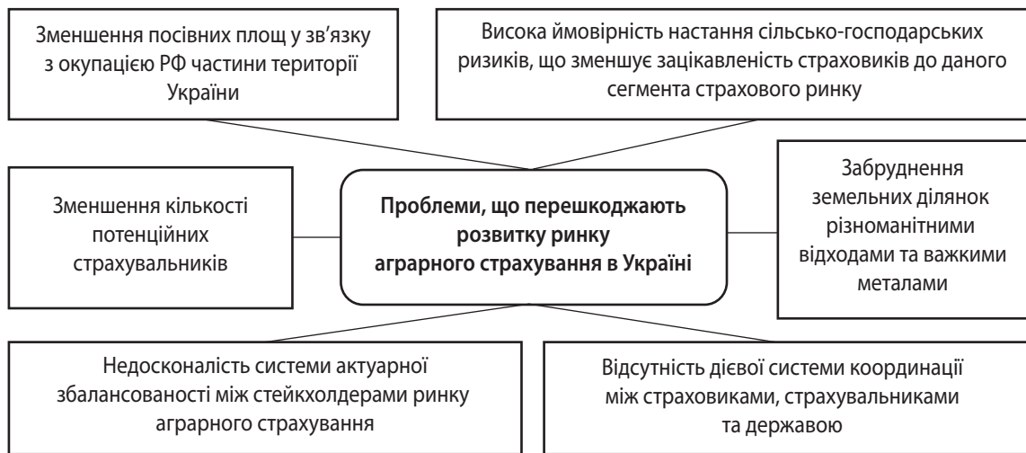
Рис. 2. Проблеми, що перешкоджають розвитку ринку аграрного страхування в Україні