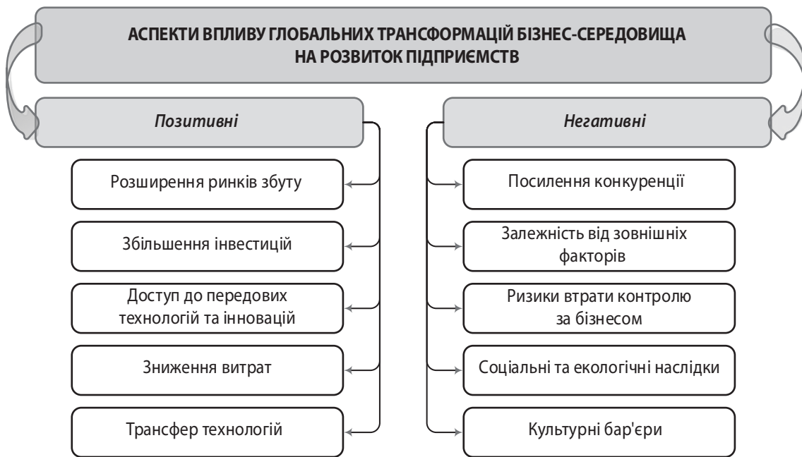
Рис. 3. Аспекти впливу глобальних трансформацій бізнес-середовища на розвиток підприємств

дення стають доступнішими завдяки глобалізації, що, безсумнівно, дозволяє підприємствам залучати фінансування для розвитку, модернізації та розширення своєї діяльності.