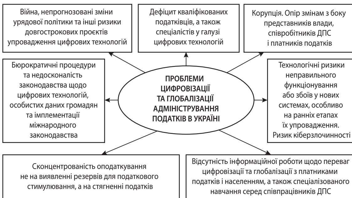
Рис. 2. Проблеми цифровізації та глобалізації адміністрування податків в Україні