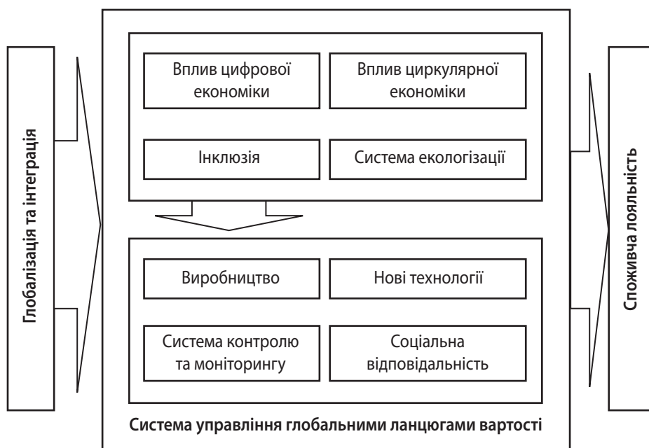
Рис. 2. Система управління глобальними ланцюгами вартості