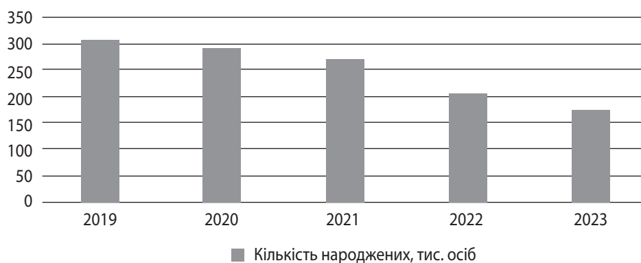
Рис. 1. Зміна кількості народжених в Україні у 2019–2023 рр.

Відносні показники розраховано автором.