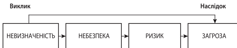
Рис. 1. Послідовність формування причин порушення економічної безпеки в державній регуляторній політиці

І хоча наявність значного бюджетного дефіциту є достатньо суттєвою проблемою для багатьох країн світу, особливої гостроти вона набуває для країн з трансформаційною економікою, зокрема України.