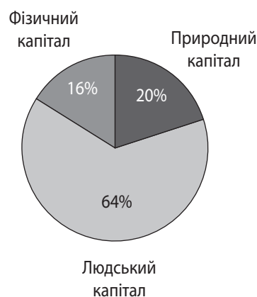
Рис. 2. Структура багатства країни, %

Наявність вищої освіти не тільки істотно знижує ризик бідності та підвищує імовірність отримання середніх доходів, але і значно впливає на спосіб життя, зокрема споживчу поведінку.