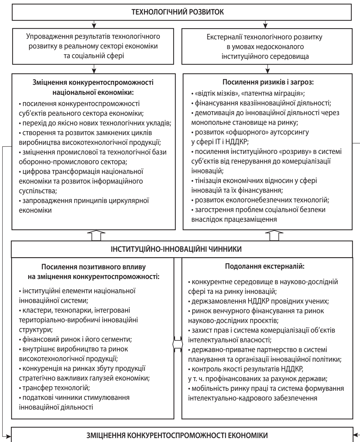
Рис. 1. Дуальний вплив технологічного розвитку та інституційних чинників на зміцнення конкурентоспроможності національної економіки