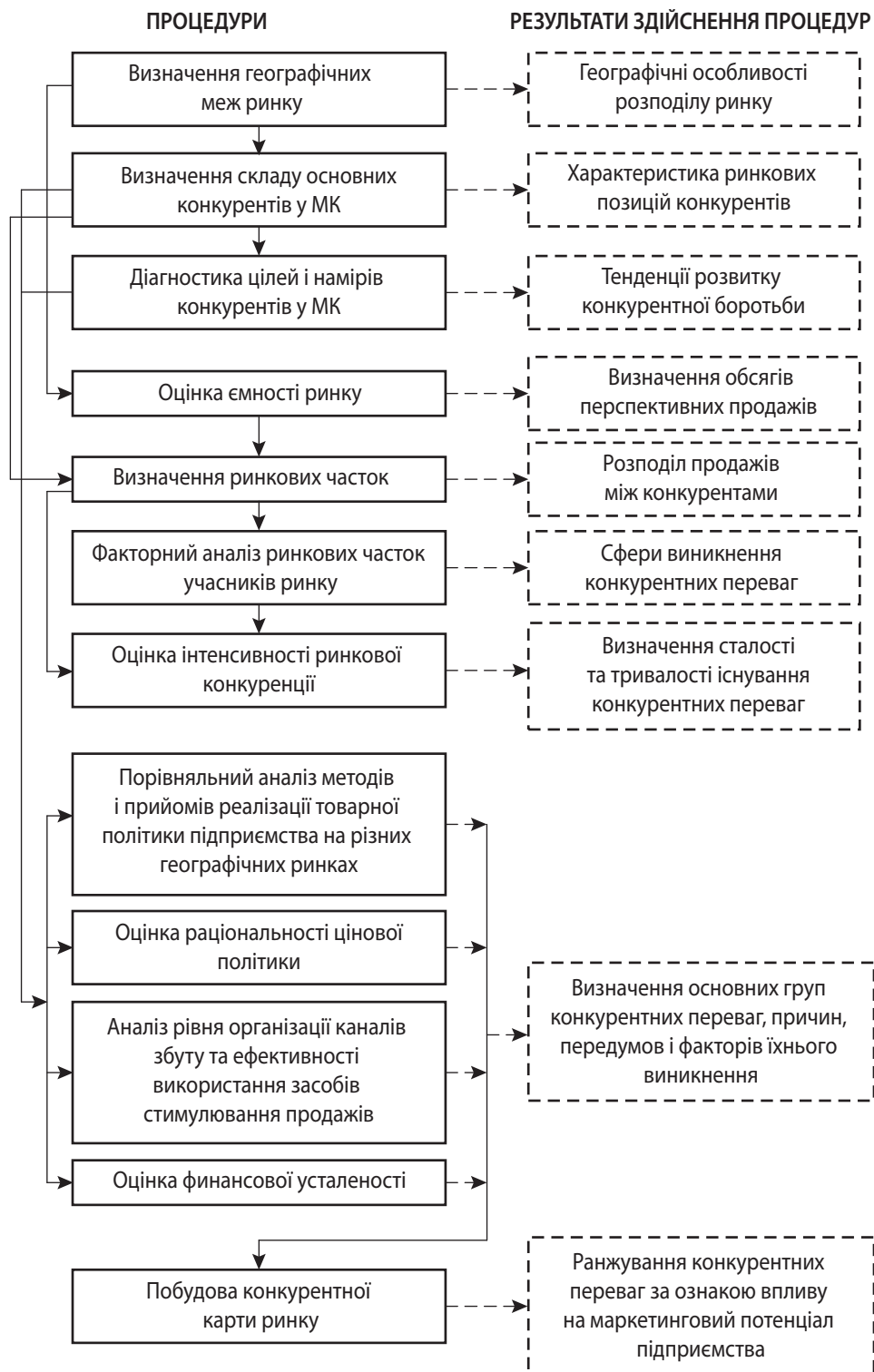
Рис. 1. Загальна послідовність дослідження передумов формування та розвитку маркетингового потенціалу підприємства